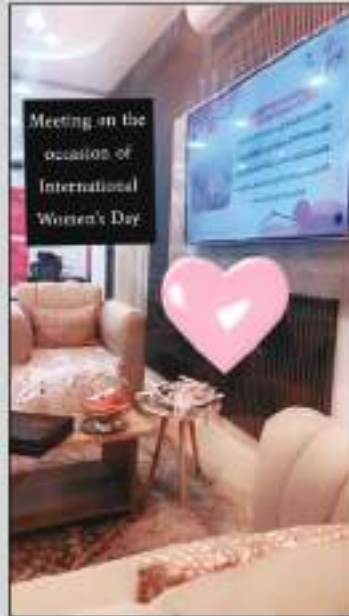
Meeting on the occasion of International Women's Day